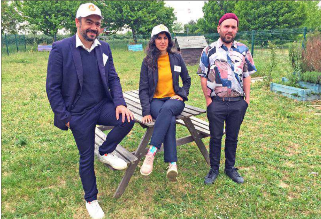
Les membres de l'agence «A Venir», alias le groupe de théâtre du laboratoire urbain d'interventions temporaires (LUIT), poursuivent l'aventure destinée à faire du quartier un haut lieu du tourisme international.

Initié lors de Coup de Chauffe, ce projet décalé mené par la Cie «LUIT» avec les habitants se poursuit. Un guide touristique va voir le jour.